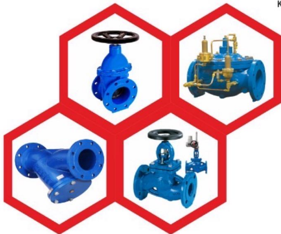
شیرآلات چدنی ، سوزنی ، کشویی ، صافی ، یکطرفه فشار کاری Pn10 ,Pn16 ,Pn25 مارک های : وگ ایران ، فاراب ، میراب ، KSB از سایز ۱/۴ اینچ الی ۲۴ اینچ