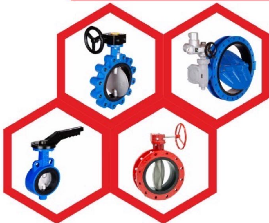
شیرآلات پروانه ای گیربکس دار و اهرمی PN10, PN16 مارکهای میراب و چینی از سایز ۱/۴ اینچ الی ۵۶ اینچ